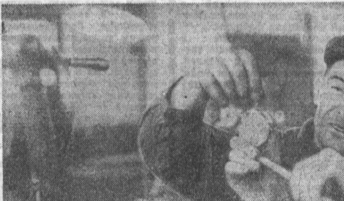
На три месяца раньше срока завершил план пятилетки коллектив Михайловского районного объединения «Сельхозтехника». А план нынешнего года по производству и реализации продукции выполнен к 7 ноября. Решено помочь трудящимся района в выполнении обязательств — отремонтировать к новому году 40 комбайнов и 35 тракторов.

До конца квартала осталось не так много времени. Нужно наверстать упущенное. Сделать все необходимое, чтобы почвообрабатывающие и посевные машины были отремонтированы не позднее 1 января 1971 года, а тракторы — к 1 марта.