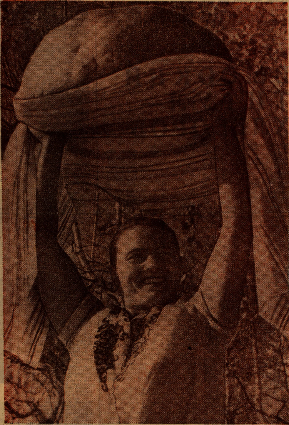
ХОРОШИЙ УРОЖАЙ ВСЕГДА БЫЛ И БУДЕТ ВЕЩАТЬ ТРУД ХЛЕБОРОБА. В БОЛЬШОЙ КАРАВАЙ ХЛЕБА, КОТОРЫЙ ДАЛ В ЭТОМ ГОДУ РОДИНЕ АЛТАЯ, ВНЕСЕНА НЕМАЛАЯ ДОЛЯ И МЕХАНИЗАТОРА ПЕРВОГО КЛАССА СОВХОЗА «КОМСОМОЛЬСКИЙ»...

В эти дни труженики села развернули деятельную подготовку к XXIV съезду партии. По почину механизаторов Кулундинского и Михайловского районов разворачивается соревнование за своевременную и высококачественную подготовку техники к полевым работам будущего года.