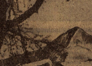
МЮШТЫ-АЯРЫ (Горный Алтай).