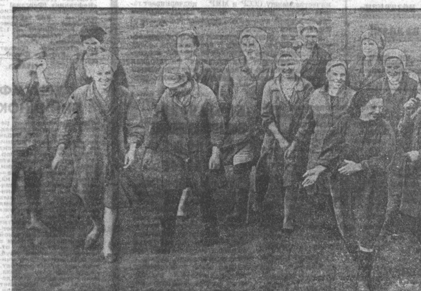
В соревнованиях двух районов по надою молока первое место занимают доярки колхоза имени Мамонтова Романовского района. С начала года по ферме надоено свыше 2.330 килограммов молока на каждую фуражную корову (в центре).

Еще недавно по дорогам районов шли машины, везущие хлеб государству (вверху).