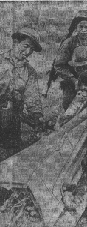
Фотосъемка в провинции Куангчи. Партизаны и бойцы Народных вооруженных сил освобождают территорию от американских бомбардировщиков, свято патриотами из стрелкового оружия.

ПАРТИЗАНЫ И БОЙЦЫ НАРОДНЫХ ВООРУЖЕННЫХ СИЛ ОСВОБОЖДЕНИЯ ОСМАТРИВАЮТ ОБЛОМКИ АМЕРИКАНСКОГО БОМБАРОДИРОВЩИКА, СВЯТОГО ПАТРИОТАМИ ИЗ СТРЕЛКОВОГО ОРУЖИЯ.