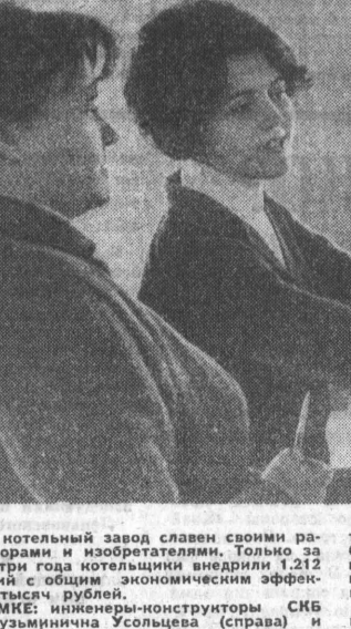
Бийский котельный завод славен своими рационализаторами и изобретателями. Только за последние три года котельники внедрили 1212 предложений с общим экономическим эффектом 1.387 тысяч рублей.

Коллектив СМУ-605 треста «Связьстрой» 10 октября завершил программу 1970 года как по объемам работ, так и по вводу объектов в эксплуатацию. Причем задание по устройству внутрипроизводственной связи в колхозах и совхозах перевыполнено соответственно на 12 и 38,5 процента. Связаны в честь предстоящего XXIV съезда КПСС и 53-й годовщины Октября взялись завершить свою пятилетку до ноября.