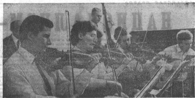
На Алтай прибыл ансамбль Московского высшего технического училища имени Баумана.