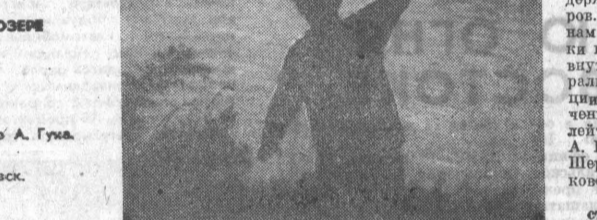
НА ОЗЕРЕ БЕГОМ. г. Рубцовск.

Они стоят на одной из песчаных сопки у озера Горького. Рука ли чья посадила их там, сама ли природа так своеобразно проявила себя, неизвестно... Только эти серебристые тополя, когда бываешь в тех местах, всегда навевают особенное чувство.