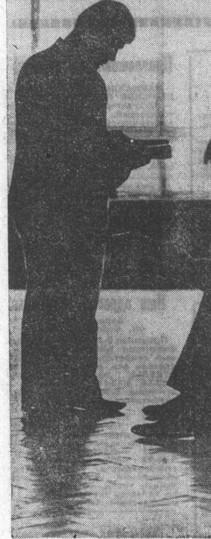
Накануне экзаменов. Надо еще раз освежить в памяти формулы и законы. Ведь в экзаменационной комнате справочника под руками не будет.

В ОБЩЕЖИТИИ ПМК-570, где располагается студенческий строительный отряд, звучит мягкая литовская речь. Коренящийся парень шуточно рассказывает сон, гадая, к чему бы он; или третья бетономешалка дадут, или цемент из Вильки везут. Приятеля парня сопровождают гадание вышками промышленного смеха.