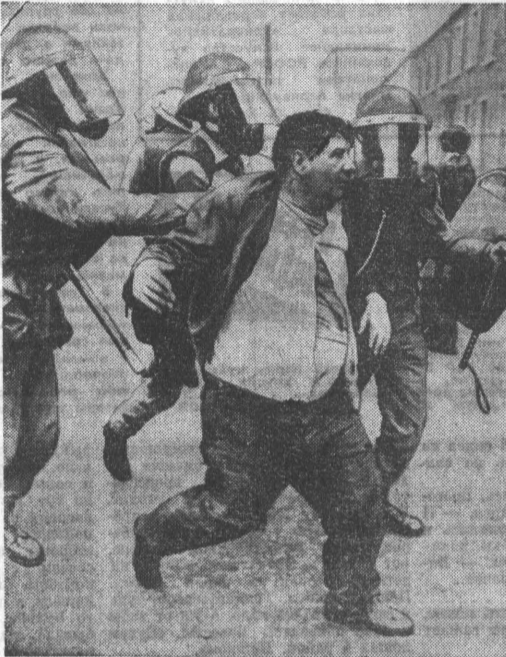
А. АКСЕНОВ. (ТАСС).