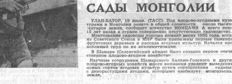
Улан-Батор, 19 июля. (ТАСС). Под плодово-ягодными культурами в Монголии занято в общей сложности около тысячи гектаров земли, сообщает агентство МОНЦАМЭ. А всего лишь 15 лет назад в стране совершенно отсутствовало садоводство.