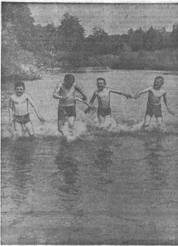
Хорошо летом на реке!

Радиус мест массового отдыха барнаульцев довольно широк. В минувшие выходные много жителей города с семьями провели свой досуг в окрестностях пристани Кукуйской, что ниже Барнаула на Оби километрах в семидесяти, там где она принимает в себя многоводный Чумыш. Все здесь очень живописно. На песчаных отмелях рек отлично загорать. Хорошо побродить в тенистом лесу, посидеть около веселого костра за чайком или наваристой ухой. Раздолье тут и рыбакам, и ягодникам, и грибовникам. Кто побывает на Кукуйской — не пожалейт этих живописных мест. П. ЛЮБИМОВ.