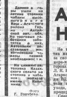
Далеко в горы ушли на летние стоянки пастухи высокогорья. Алтайской обл. Но торговые работники забывают о них. Автолавки доставляют животноводов товары первой необходимости к и. На снимке: автолавка Казахского сельхоза на стоянку у чабынов колхоза имени Калинина.