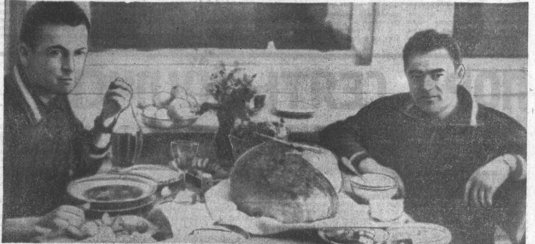
НА СНИМКЕ: первый земной обед космонавтов А. Г. Николаева (справа) и В. Н. Севаст'янова после возвращения из космоса.

Хороший быт, вкусная пища, культурный отдых после рабочего дня — все это должно также создавать высокий трудовой напор на лугах, служить выполнению плана производства и заготовок продуктов животноводства завершающего года пятилетки.