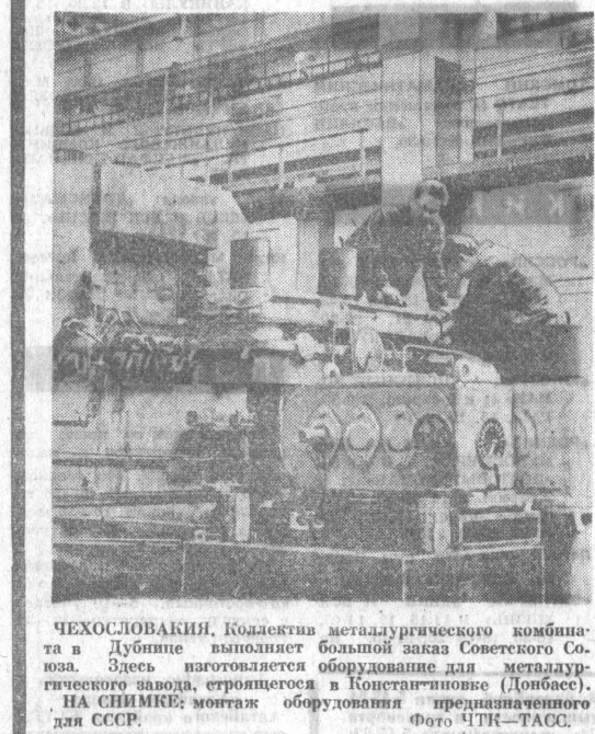
ЧЕХОСЛОВАКИИ. Коллектив металлургического комбината в Дубнице выполняет большой заказ Советского Союза. Здесь изготовляется оборудование для металлургического завода, строящегося в Констанц-Ново (Донабсе). НА СНИМКЕ: монтаж оборудования предназначенного для СССР.