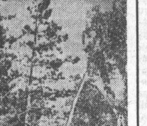
Край родной.