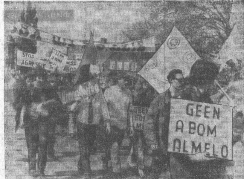
ГОЛЛАНДИЯ. Сотни жителей Алмеда вышли на демонстрацию протеста против строительства в их городе завода обогащения урана. О создании этого предприятия имеется договоренность между правительствами Англии, Голландии и Западной Германии.

Джон АБТ, американский юрист. (АПН). Нью-Йорк.