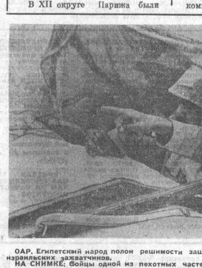
ОАР. Египетский народ полон решимости защищать свою страну, обуздать израильских захватчиков. НА СИМКЕ: бойцы одной из пехотных частей во время военных маневров.