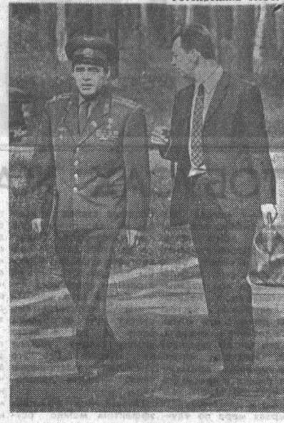
А. Г. Николаев и В. Н. Севастьянов в подмосковном лесу.