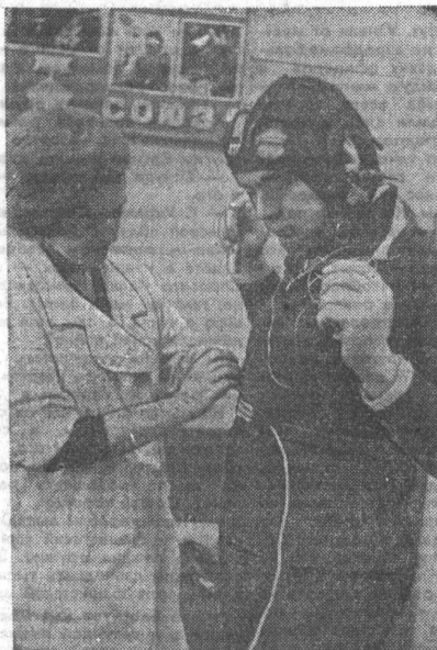
Летчик-космонавт А. Г. Николаев на тренировке. Наглядные датчики.