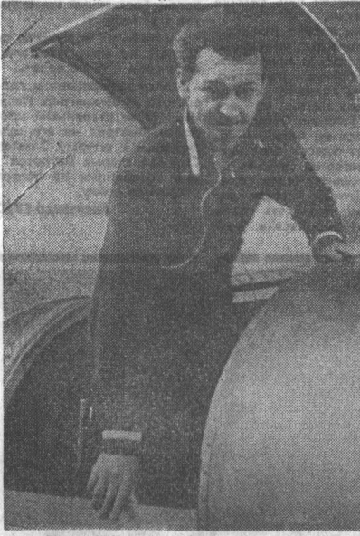
Виталий Иванович Севастьянов на центрифуге.