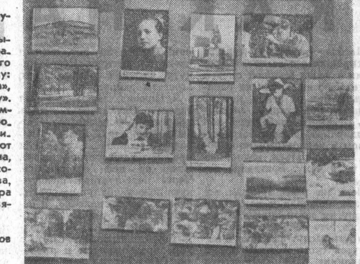
На снимке: один из уголков выставки.