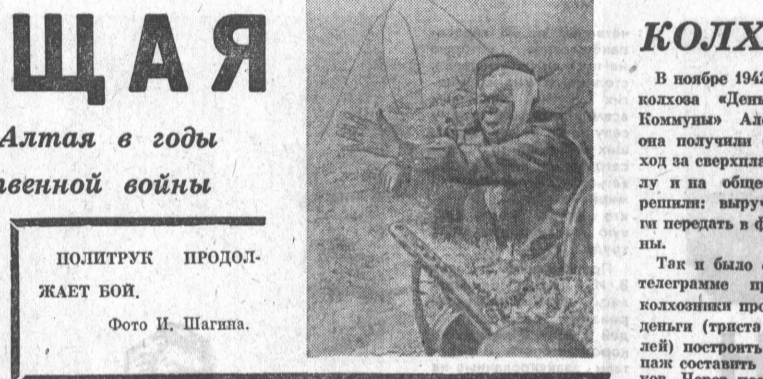
ПОЛТРУК ПРОДОЛЖАЕТ БОИ.