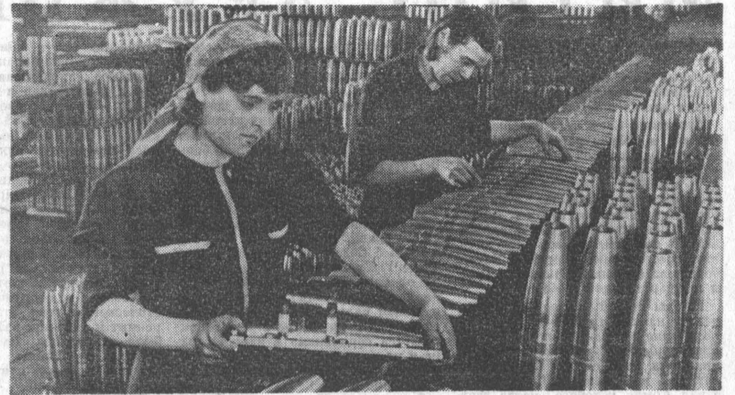
ТЫ Л — ФРОНТУ! МОСКВА. Подготовка снарядов к отправке на фронт. (Снимок военных лет).