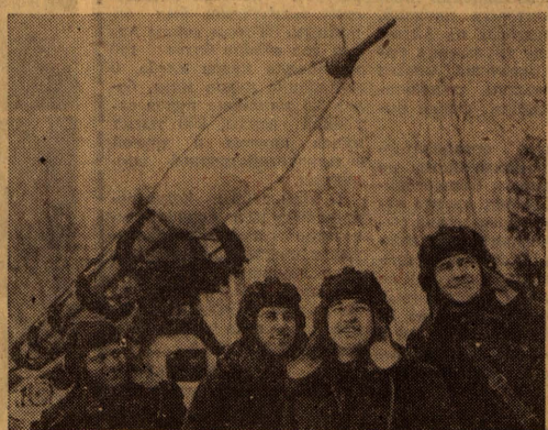
(Окончание на 4-й стр.)