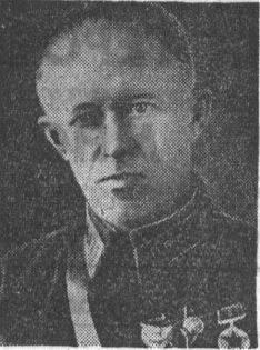
ПОЛКОВНИК Н. И. ДЕМЕНТЬЕВ. (Снимок предвоенных лет).

В ПЕРВЫЕ ДНИ и недели войны о ней знала вся страна. Под звонкими стихотворными шапками о ней рассказывалось на первых страницах газет: « НАВЕКИ ОВЕЯННЫЙ СЛАВОЙ КРЫЛАТОЙ, ДА ЗДРАВСТВУЕТ ПУТЬ ДЕВЯНОСТО ДЕВЯТОЙ! ».