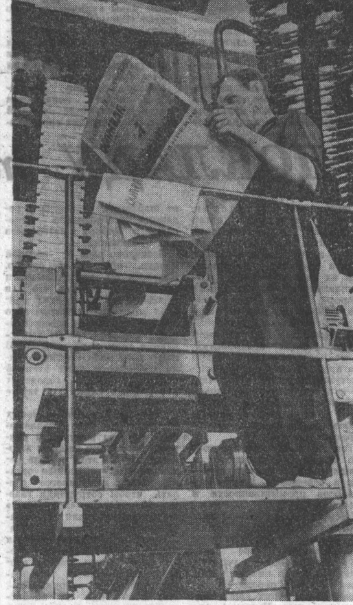
Для десятков тысяч жителей Барнаула и других городов нашего края стало привычным получать центральные газеты «Правду», «Известия», «Советскую Россию», «Сельскую жизнь» в день их выхода. Это стало возможно благодаря бурному развитию современной полиграфической техники.