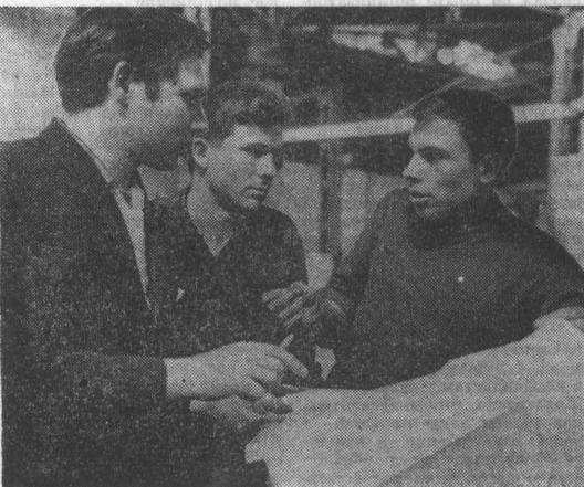
Коллектив седьмого механискомоторного цеха Алтайского завода «Алтайсельмаш» работает на праздничном предприятии.

С. ИЗВОЗЧИКОВ , главный агроном совхоза «Славгородский».