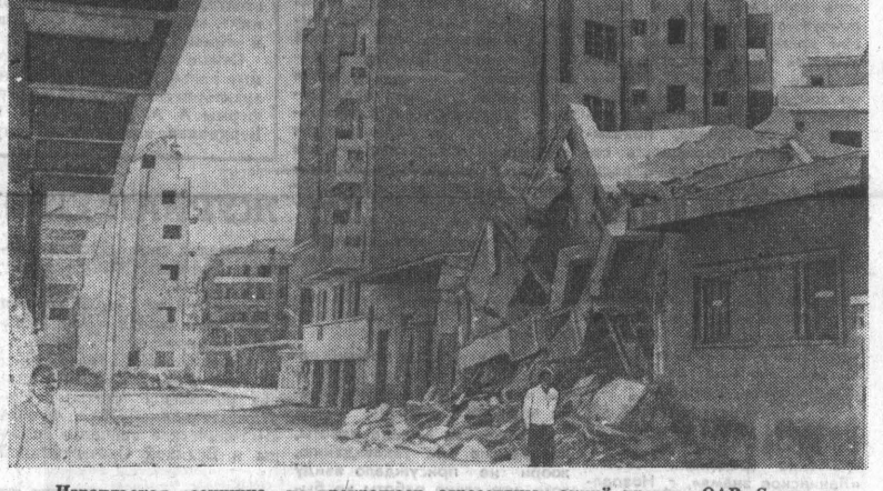
Израильская военщина не прекращает агрессивных акций против ОАР. Среди египетских городов, расположенных на побережье Суэцкого канала, Суэц больше других страдал от воздушных налетов и артиллерийских обстрелов противника. Здесь целые кварталы полностью разрушены или сильно повреждены жилых зданий, полуразрушенные школы, больницы, мечети, кинотеатры, груды битого кирпича, камня и стекла. НА СНИМКЕ: разрушенные израильской авиацией дома в одном из районов Суэца.