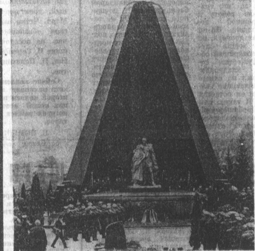
9 мая — 25 лет со дня освобождения (1945) Чехословакии от фашистских захватчиков, национальный праздник народов Чехословакии.