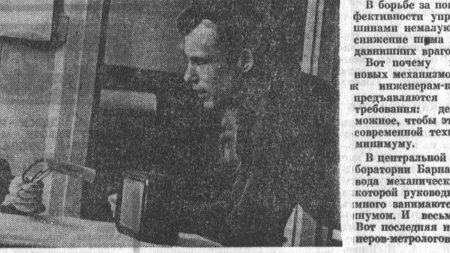
В борьбе за повышение эффективности управления...