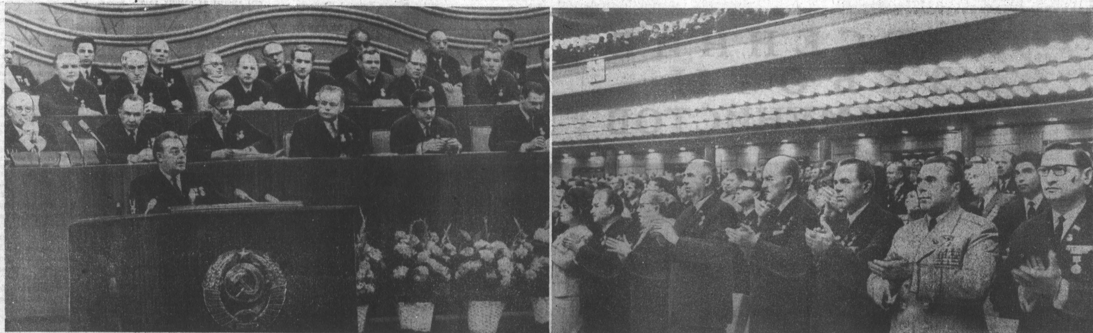
МОСКВА. Кремлевский Дворец съездов. Совместное торжественное заседание ЦК КПСС, Верховного Совета СССР и Верховного Совета РСФСР, посвященное 100-летию со дня рождения В. И. Ленина.