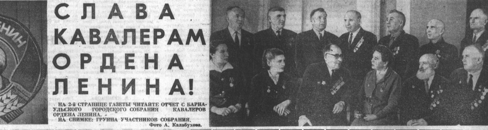
НА СНИМКЕ: ГРУППА УЧАСТНИКОВ СОБРАНИЯ.