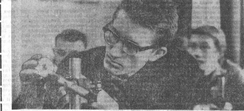
В этом году исполняется десять лет вечернему сменному училищу профтехобразования на Алтайском моторном заводе. За это время здесь повысил квалификацию и стали мастерами смеи и участвовало 2.925 моторостроителей.