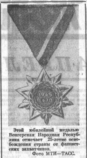
Этой юбилейной медалью Венгерская Народная Республика отмечает 25-летие освобождения страны от фашистских захватчиков. Фото МТИ-ТАСС.