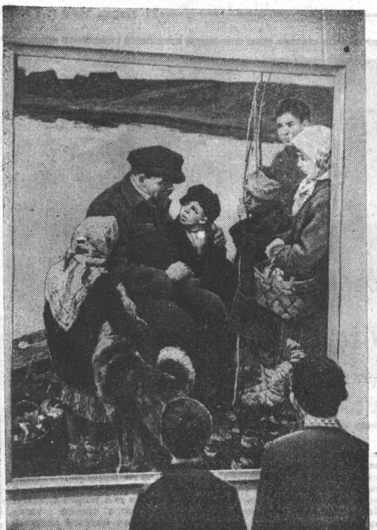
ЛЕНИНГРАД. В залах Русского музея открылась юбилейная выставка произведений ленинградских художников, посвященная 100-летию со дня рождения В. И. Ленина. НА СНИМКЕ: у картины художника С. Ласточкина «Ленин и дети».