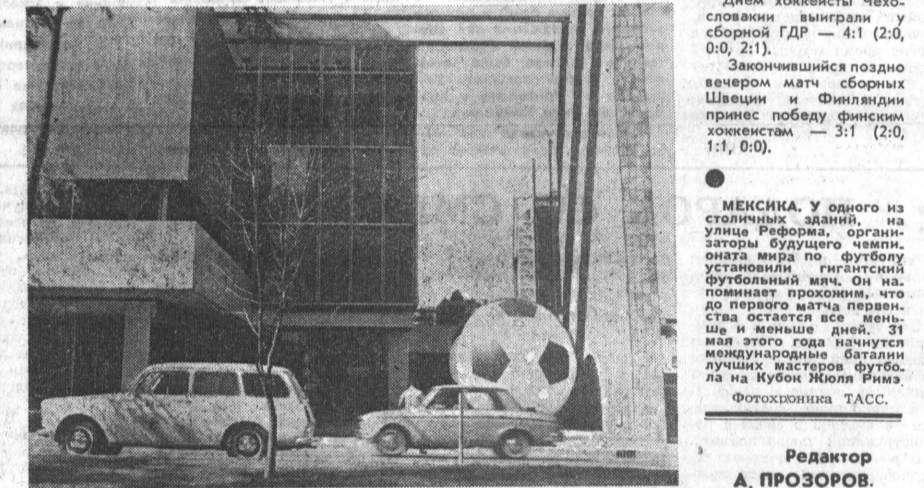
Редактор А. ПРОЗОРОВ.

СТОКГОЛЬМ, 17 марта. (Спец. корр. ТАСС В. Дворцов, Д. Ершов). В матче третьего тура чемпионата мира хоккеисты сборной СССР выиграли у польской команды — 7:0 (2:0, 5:0, 0:0). Сегодня тренеры вновь маневрировали составом (правда, Шалрин и Якушев пока на лед не выходили). В матче с польской командой автором по омереги защитники Комозаново и Третьяк, отдавшего Харламова заменил Полупанов, а на месте последнего играл Михаил Кожаново, нельзя сказать, что выступление чемпионов оставило яркое впечатление. Наши хоккеисты, возможно, сберечь силы для будущих встреч, играли как-то вяло. Полупанов чемпионы не могли открыть счет. Даже первое численное преимущество не было реализовано. В начале третьего периода Мальцев не реализовал штрафной бросок. Кстати, процент использования штрафных моментов у чемпионов был слишком велик. Лучшим игроком встречи признан Фирсов, он забил два гола и сделал шесть результативных передач. С восьмью очками он на первом месте по результативности. Впереди у нашей сборной самые трудные испытания — матчи с командами Чехословакии и Швеции. Днем хоккеисты Чехословакии выиграли у сборной ГДР — 4:1 (2:0, 0:0, 2:1). Закончившийся поздно вечером матч сборных Швеции и Финляндии принес победу финским хоккеистам — 3:1 (2:0, 1:1, 0:0).