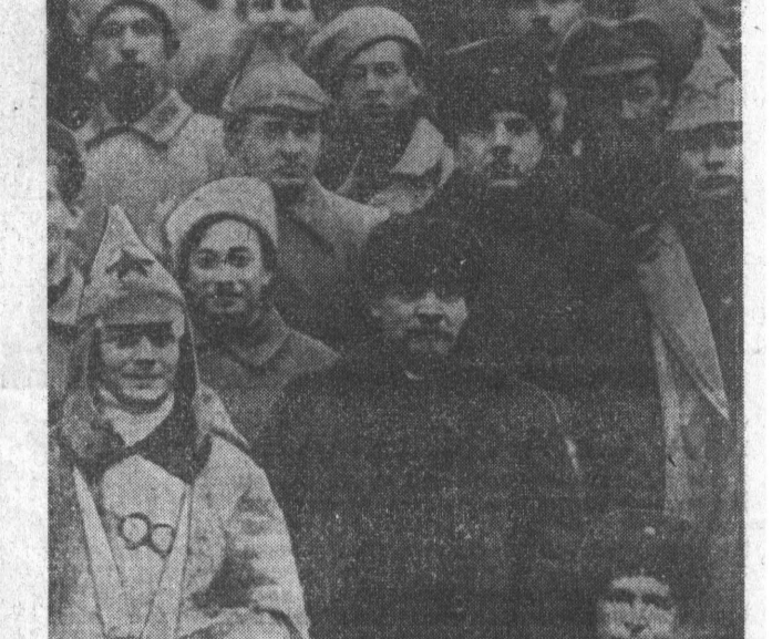
НА СНИМКАХ: В. И. Ленин заглядывает первый камень в основание памятника К. Марксу, В. И. Ленин и К. Е. Ворошилов в группе делегатов X съезда РИП(б) — участников подавления Кронштадтского мятежа.