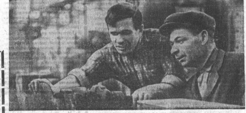
В прошлом году на Алтайском моторном заводе введено в строй снимать автоматических линий на обработке главных деталей двигателей.

Производством дорожек для поля в Мамонтовском комбинате бытового обслуживания занимаются совсем недавно, но с немалым успехом. Красочные, добротные, они сразу стали пользоваться широким спросом. «Свет Октября». Мамонтовский район.