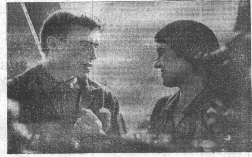
Достойный подарок к 100-летию со дня рождения В. И. Ленина готовят рублевские тракторостроители. Во всех цехах, начиная от литейного и кончая сборочным, ширятся социальные соревнования.