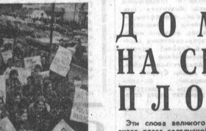
НЬЮ-ЙОРК. Несколько тысяч жителей крупнейшего города США приняли участие в демонстрации протеста против позорного судебного приговора вынесенного Чикагским федеральным судом группе активистов американского антикоммунистического движения. НА СНИМКЕ: во время демонстрации.

Дакар, 2 марта. (ТАСС). Незаконное провозглашение республики в Южной Родезии, а также пособничество западных держав реакционному режиму Смита вызывает гневное возмущение африканских стран, говорится в комментарии радио Дакара. Наряду с Англией, которая является главной союзницей расистов, возмущение радио Дакара, ответственность за провозглашение Южной Родезии несут также США и ФРГ. Они грубо по-