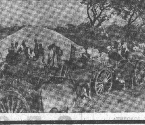
Американская авиация продолжает бомбить Камбоджу.

ПНОМПЕНЬ, 19 февраля. (ТАСС). 7 камбоджийцев убито и 27 ранено в провинциях Кампад, Монпонгчам и Кратие в результате военных воздушных налетов американской авиации на территорию Камбоджи за последние недели. Инд Камбоджи направил посольству США в Пномпене ноту, в которой выражает решительный протест правительству Соединенных Штатов. В нотке подчеркивается, что американское правительство должно прекратить агрессивные действия против Камбоджи.