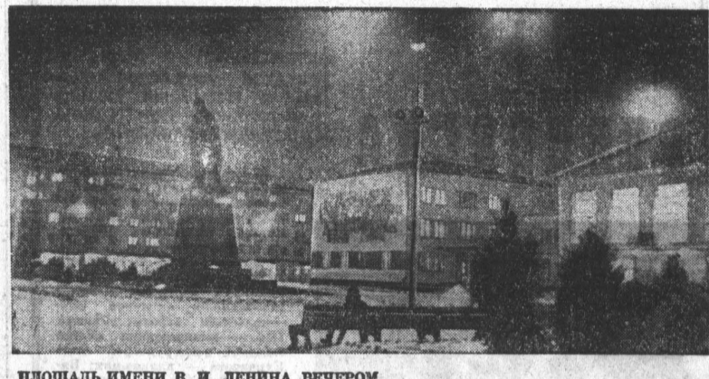
ПЛОЩАДЬ ИМЕНИ В. И. ЛЕНИНА ВЕЧЕРОМ.

В городе Рубцовске созданы условия для жизни и работы. В последние годы его коллектив практически обновил всю выпускаемую продукцию, заменив устаревшие образцы новыми сельскохозяйственными машинами. На международной выставке в Москве в 1967 году изделия завода «Алтайсельмаш» — ярусный плуг ПШ-40 и плуг «Дружинка» — были отмечены золотыми медалями.