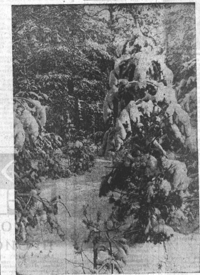
ЗИМНИЙ ПЕЙЗАЖ.

Аэрация может проводиться с помощью установок разбрызгивающих столбиков, аэронок, вертушек. Для механической аэрации можно применять лопастные вентиляторы, подвесные лодочные моторы, мотопомпы. Все механические способы аэрации связаны со снижением температуры. Аэрация без снижения температуры воды производится с помощью воздушных компрессоров. Они нагревают воздух, сжимают его, в результате температура воздуха повышается. Компрессор соединяется с резиновым шлангом, в котором шлангом прокалывают отверстие. Шланг укладывают на дно водоема и заглубляют. Нагнетанный воздух проходит через отверстие шланга.