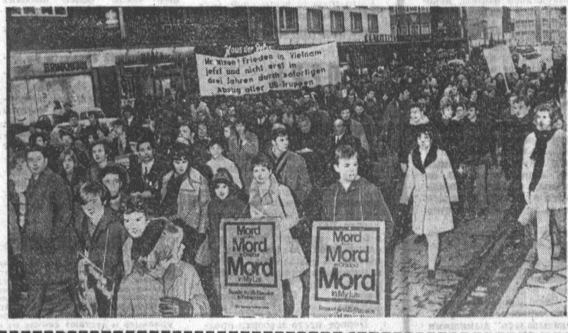
Демонстрация протеста против агрессии США во Вьетнаме состоялась в Дюссельдорфе — крупнейшем центре индустриального Рура. Более 2.000 ее участников прошли по улицам города, протестуя против зверств американской авиации и требуя немедленного вывода войск США.

должно быть обеспечено мирное сосуществование и установление нормальных отношений между обоими германскими государствами на основе общепризнанных международных правовых норм. (ТАСС.)