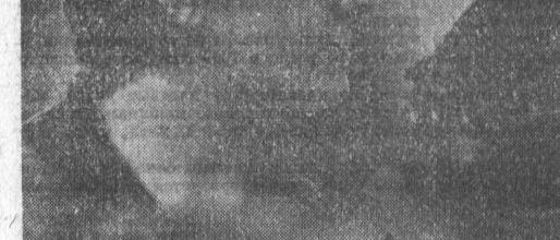
Многое предстоит сделать и для улучшения реализации овощеводческой продукции. Зачастую заготовительные организации в период массового сбора овощей не могут своевременно принять их от хозяйства. Это приводит к ухудшению качества овощей, их порче. В результате горожане получают продукцию пониженного качества, а хозяйствам-поставщикам наносится значительный экономический ущерб. Убытки специализированных хозяйств составили в 1965 году — 121, в 1966 — 72 и в 1967 — 70 тысяч рублей. В настоящее время качество продукции определяется на овощебазах и часто — необъективно, в убыток хозяйствам.

Поступил ответ и от Рубцовского горисполкома, подписанный председателем исполкома т. Красновым, но он совершенно не объясняет, что будет предпринято для улучшения условий работы подрядчика, для более планомерного строительства и ввода объектов в эксплуатацию.