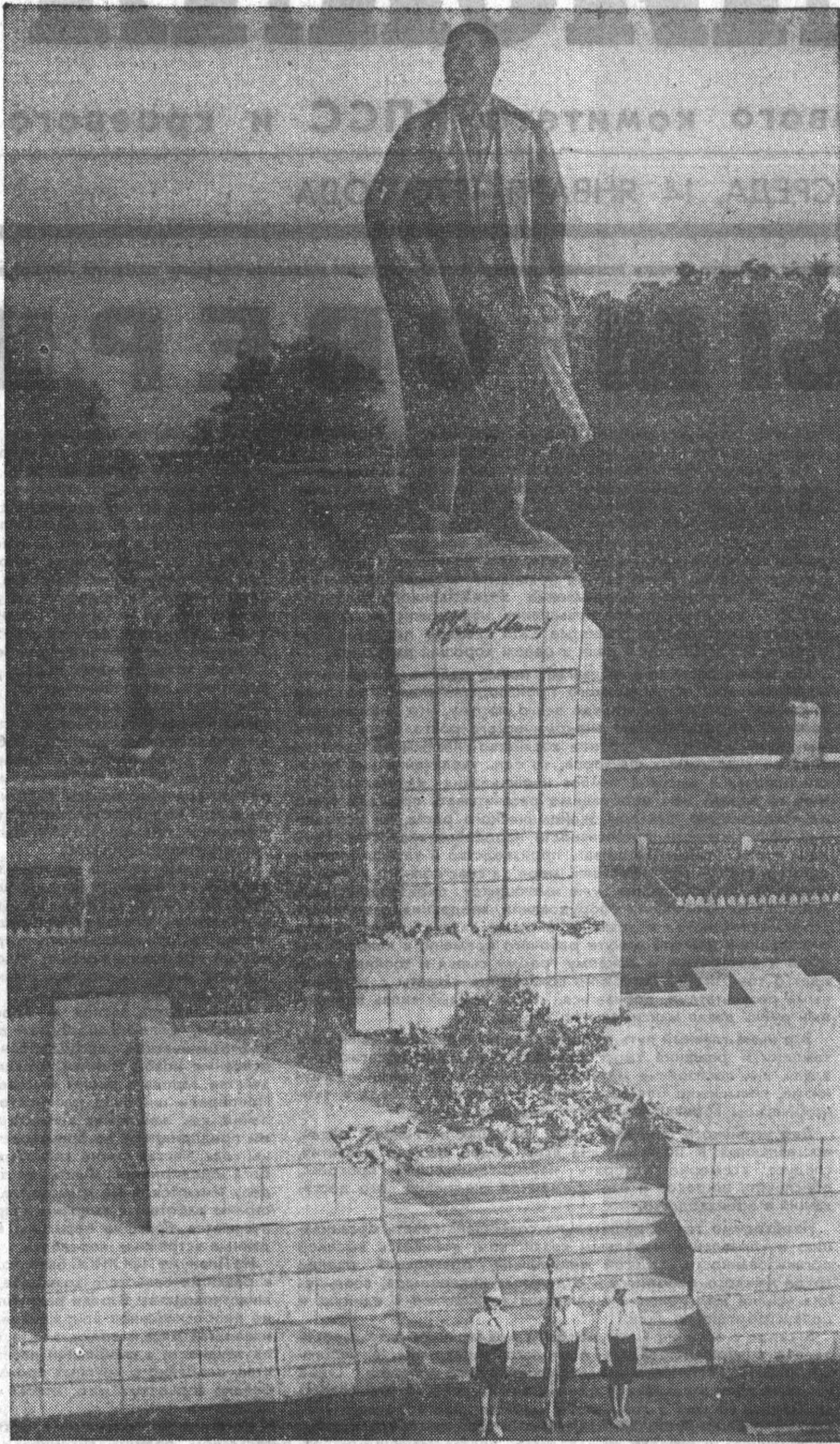
ПАМЯТНИК В. И. ЛЕНИНУ НА ЛЕНИНСКОЙ ПЛОЩАДИ ГОРОДА.

На этой странице рассказывается о ленинских местах Ульяновска и о том, каким станет мемориальный центр, сооружаемый на родине Ильича.