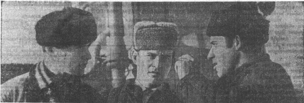
[Окончание. Начало на 1 стр.]

Переступив порог Енисейской средней школы, первокурсник начинает познавать радость сельскохозяйственного труда. В классных комнатах, в коридорах, в ораде — цветы. И учителя по установившейся традиции первый урок начинают с рассказа о школе. О том, что она построена на средства колхоза и что такой краской и нарядной ее сделали сами ученики. Так с первого урока ребят приучают к мысли, что им придется здесь не только учиться, но и трудиться. И они охотно ухаживают за цветами, потом работают на пришкольном участке, а старшкклассники — в ученической производственной бригаде.