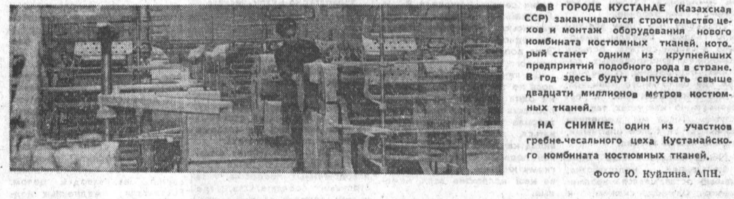
В ГОРОДЕ КУСТАНАЕ (Казахстан ССР) заканчиваются строительные работы и монтаж оборудования нового комбината костюмных тканей...

В строительстве реформа будет осуществляться поэтапно, что позволит избежать серьезных последствий.