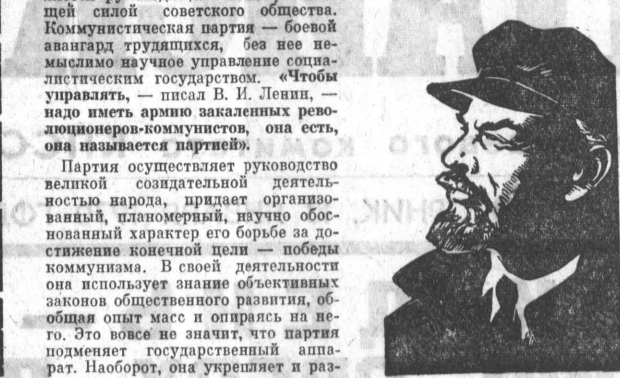
Ленинский лекторий «Алтайской правды»

«ОПИРАЯСЬ НА ТЕОРИЮ МАРКСИЗМА-ЛЕНИНИЗМА И НАКОПЛЕННЫЙ ОПЫТ БОРЬБЫ, КПСС ВЫРАБАТЫВАЕТ ПОЛИТИЧЕСКУЮ ЛИНИЮ, ОСУЩЕСТВЛЯЕТ РУКОВОДСТВО МАССАМИ, ЭКОНОМИЧЕСКОЙ, СОЦИАЛЬНО-ПОЛИТИЧЕСКОЙ И ДУХОВНОЙ ЖИЗНЬЮ ОБЩЕСТВА»