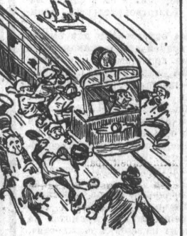
Рис. А. Урюпина.

В 7 утра кончат работу ночная смена моторного завода. На трамвайной остановке — огромная толпа. Все ожидается везд. Наконец, понаеяется трамвай, подходить ближе, но определить, какой маршрут, никому не удается: отсутствует номер. Среди ожидающих начинают волнение и давка. Время на посадку проходит, и трамвай отправляется полупустой. А ведь так