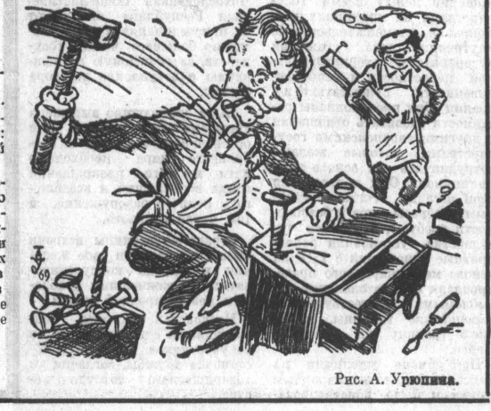
Рис. А. Урошнина.