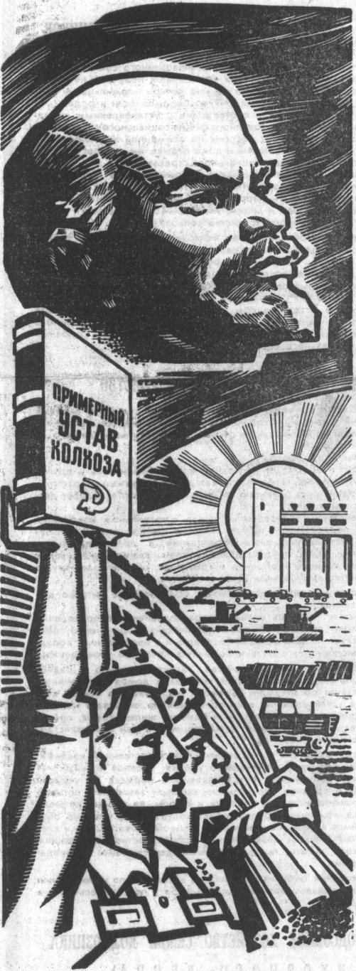
Рис. Г. Вильяма.

1. Образовать выборные Советы колхозов в районах, областях, краях, республиках и в центре. Выборы Советов колхозов производится в районах — на собраниях представителей колхозов; в областях, краях, автономных и союзных республиках, а также в центре — на собраниях представителей соответствующих Советов колхозов. 2. Избрать союзный Совет колхозов на настоящем съезде.