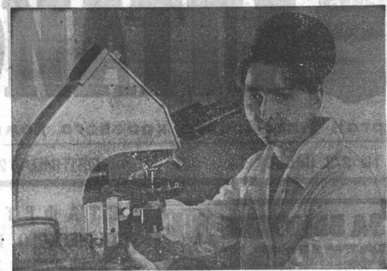
В Барнауле сдали в эксплуатацию лабораторный корпус и экспериментальный завод для Алтайского филиала Всесоюзного научно-исследовательского института маслоседелной и сыродельной промышленности.