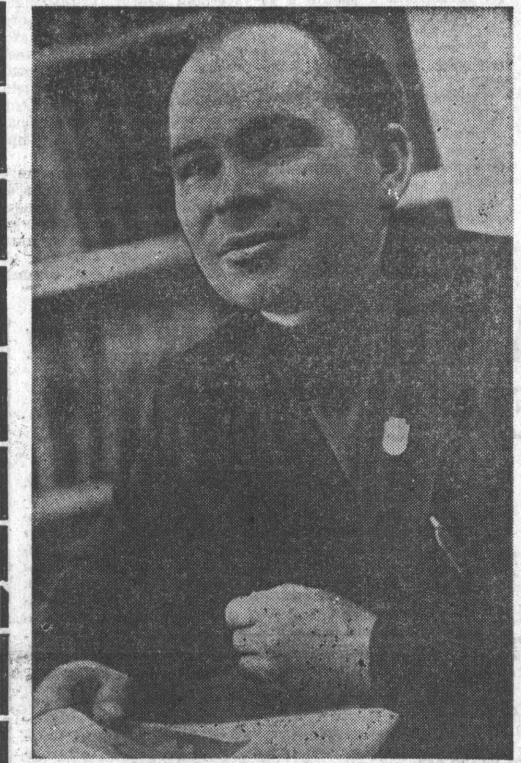
Делегаты III Всесоюзного съезда колхозников

В. РОЖДЕСТВЕНСКИЙ, корр. «Алтайской правды», Кытмановский район.