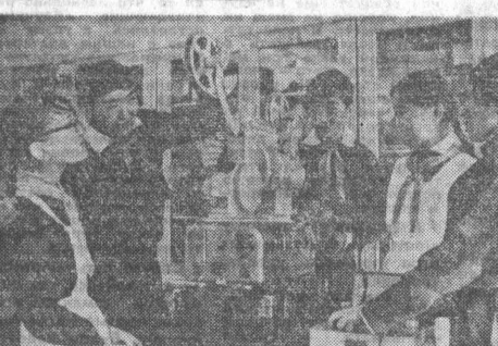
Улан-Баторская средняя школа № 33 — одна из лучших в столице МНР.

Улан-Баторская средняя школа № 33 — одна из лучших в столице МНР. Указом Президиума Великого народного хурала ей присвоено почётное имя города-героя Москвы. Школа построена в лучших условиях: приборы и оборудование для классов и кабинетов поступило из Советского Союза.