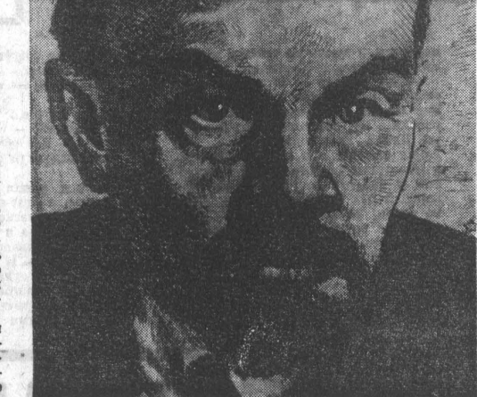
Портреты, которые видели и не видели

Героическая жизнь Альфреда Франка яркой страницей вписана в историю немецкого социалистического искусства. А имя художника, память о нем окружены в ГДР боль-