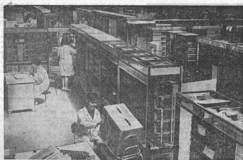
На предприятии недавно вступили в строй: комплексно-механический цех гальванических покрытий, конвейер сборки плат, автомат для определения исправности монтажных устройств.

Почти во всех отраслях народного хозяйства можно применить продукцию Киевского завода электротехнических вычислительных и управляющих машин.