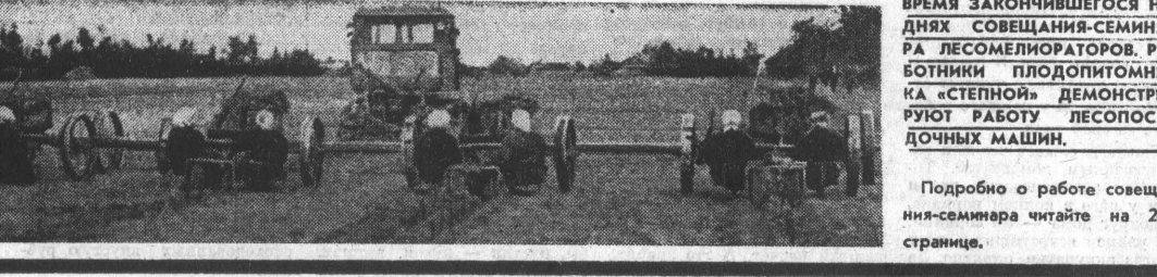
ЭТОТ СНИМОК СДЕЛАН ВО ВРЕМЯ ЗАКОНЧИВШЕГОСЯ НА ДНЯХ СОВЕЩАНИЯ-СЕМИНАРА ЛЕСОМЕЛИОРАТОРОВ РАБОТНИКИ ПЛОДОПИТОМНИКА «СТЕПНОЙ» ДЕМОНСТРИРУЮТ РАБОТУ ЛЕСОПОСАДОЧНЫХ МАШИН.