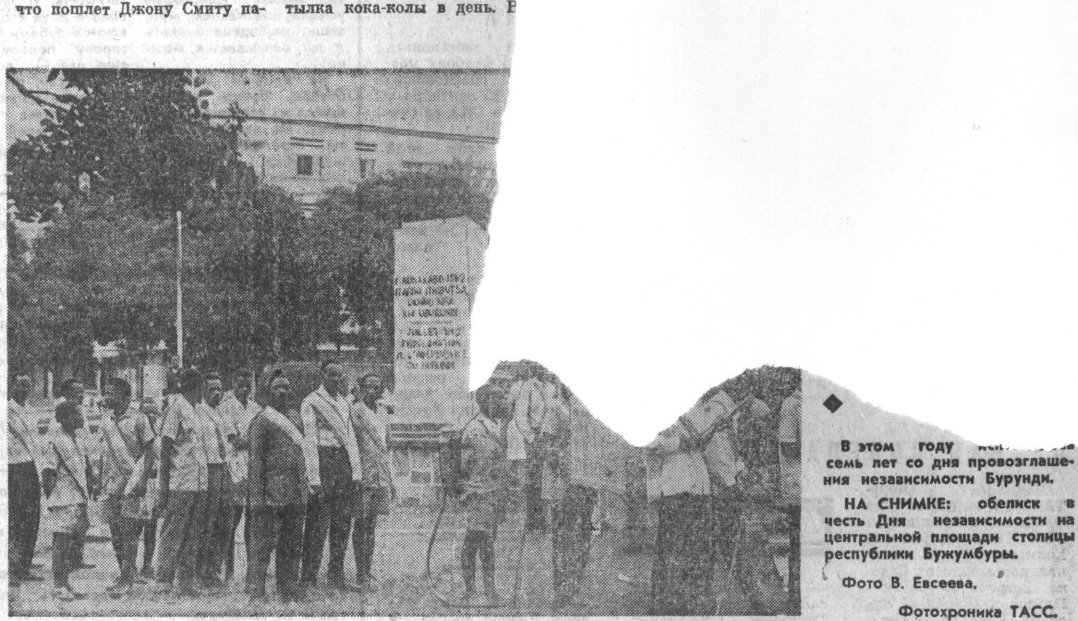
В этом году семь лет со дня провозглашения независимости Бурунди. НА СНИМКЕ: обелиск в честь Дня независимости на центральной площади столицы республики Бумумбури.

Н. ЕРМОШКИН, соб. корр. АПН, Равалпинди.