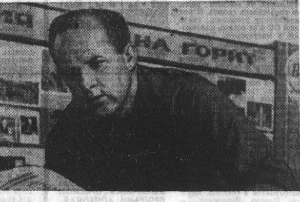
«Особенностью нового пятилетнего плана является установка на более быстрое техническое перевооружение всего народного хозяйства, прогрессивное изменение его структуры, своевременную замену устаревшей продукции новой, более совершенной». (Из Директив XXIII сессии КПСС по пятилетнему плану 1966—1970 гг.)

Чтобы до конца решить задачу замены всех моделей буровых станков на более совершенные, нам необходимо в 1970 году заменить последнюю устаревшую модель ЗИФ-650А модернизированной. Станок подготовлен. Он полу-