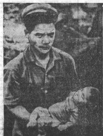
ТРЕХМЕСЯЧНЫЙ РЕБЕНОК РАБОЧЕГО ХАЙФОНГО ЦЕМЕНТНОГО ЗАВОДА В НГОК БАН, УБИТЫЙ В БОМБОУБЕЖИЩЕ.