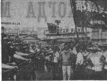
ОКОЛО 40 ТЫСЯЧ ЧЕЛОВЕК ПРИНЯЛО УЧАСТИЕ В ЗАБASTOВКЕ, ОРГАНИЗОВАННОЙ РАБОЧИМИ, ОБСЛУЖИВАЮЩИМИ АМЕРИКАНСКИЕ ВОЕННЫЕ БАЗЫ НА ЯПОНСКОМ ОСТРОВЕ ОКИНАВА. БАСТОВЩИКИ ПОДДЕРЖАЛИ ЧЛЕНОВ ДРУГИХ ПРОФСОЮЗОВ ОКИНАВЫ НА БОРЬБУ С БАСТОВЩИМИ БЫЛИ БРОШЕНЫ ОТРЯДЫ ВОЕННОЙ ПОЛИЦИИ США.