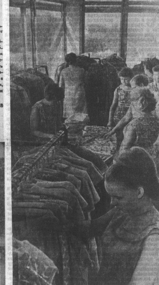
Фото и текст В. КОРОТКОВА.

НА СНИМКАХ: Дом моды в салоне полуфабрикатов.