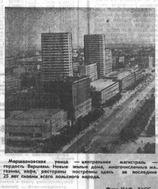
Маршалковская улица — центральная магистраль — в столице Польши. Новые жилые дома, многочисленные магазины, кафе, рестораны построены здесь за последние 25 лет силами польского народа.

«На основе союза с Советским Союзом, гарантирующего нашу безопасность и неприкосновенность границ, мы всемерно развиваем нашу страну, боремся за упрочение мира, за победу социализма во всем мире».