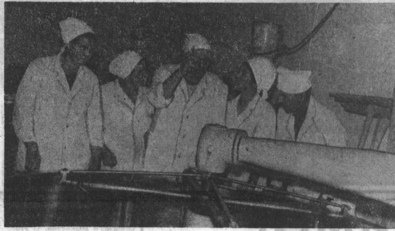
СОДРУЖЕСТВО СЫРОДЕЛОВ С УЧЕНЫМИ АРМИИ