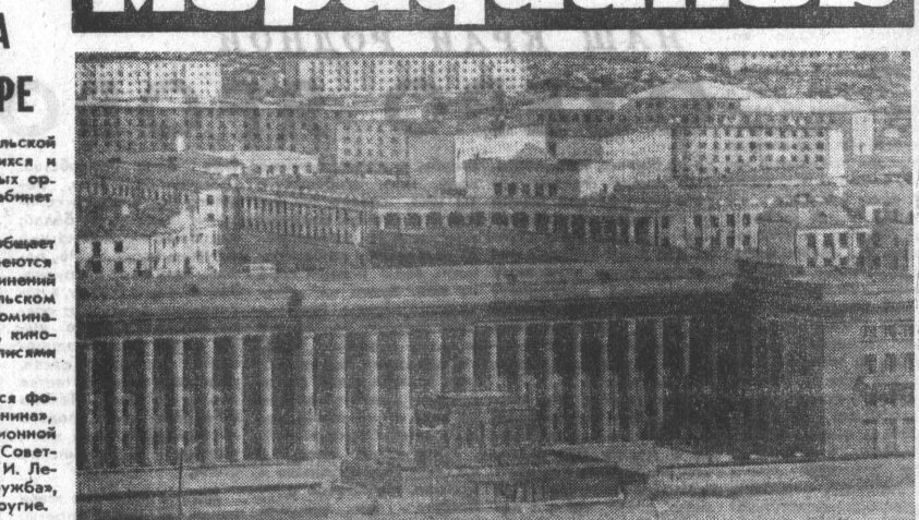
СТОЛИЦА МНР — УЛАН-БАТОР. НА СНИМКЕ: Дом правительства. Перед зданием на площади Мавзолей-усыпальница Д. Сухэ-Батора и Х. Чойбалсана.