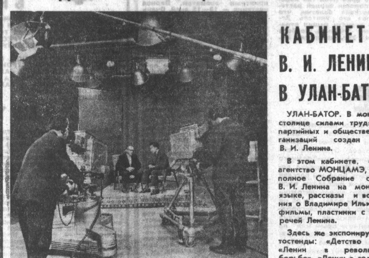
УЛАН-БАТОР. Каждый вечер в городах и аймаках Монголии зажигаются тысячи голубых экранов телевизора. Столичный телецентр имени 50-летия Октября начал регулярные передачи в сентябре 1967 года.

Он был построен с помощью Советского Союза.