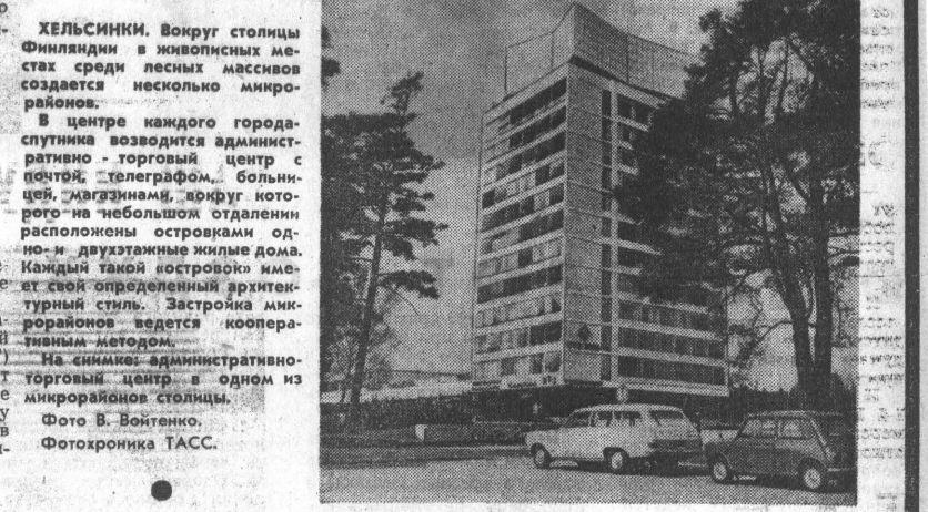
Хельсинки. Вокруг столицы Финляндии в живописных местах среди лесных массивов создается несколько микро-районов.

ЛОНДОН. (ТАСС). Через несколько дней 140-басов борются за гражданские права должны предстать перед судом военного трибунала города Бургоса, передает корреспондент английской газеты «Санди телеграф» из Мадрида. Из хорошо осведомленных кругов стало известно, что прокурор потребует трех или четырех смертных приговоров и тюремного заключения сроком на 15 лет по крайней мере для 50 обвиняемых. ПАРИЖ. (ТАСС). Несмотря на кровавый террор, развязанный франкистскими властями в Испании, и в частности в стране басков, турнищел в валду самобтерженную борьбу против диктатуры, за свободу и демократию. Как передает агентство ЮПИ, смсыласе на сообщении из Мадрида, более 13 тысяч банковских служащих в письменной форме потребовали на днях отставки ряда заправил франкистских вертикальных профсоюзов, которые участвовали в мажидналях, приведших к значительному сокращению заработной платы. Не прекращаются забастовочные выступления рабочих завода по производству искусственных удобрений в испанском городе Севилья, передает агентство ЮПИ. Они требуют пересмотра прежнего коллективного трудового договора и увеличения заработной платы на 19 процентов. Стрелк, предприниматели уволили 10 человек. Между бастующими рабочими, которые потребовали восстановления на работе уволенных, и вооруженной полицией произошли серьезные столкновения.