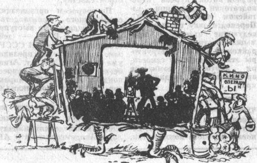
Рис. А. Урюпина.

Кулисы весной не уничтожаются. Предпосевная обработка проводится обычным способом. Пшеницу сеют сеялками СЗС-9 поперек кулис. Если же себ ведется вдоль кулис, то следует обязательно уничтожить дискиными культиваторами во время предпосевной обработки.