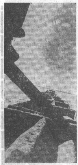
Текст и фото В. ДУХАНИНА