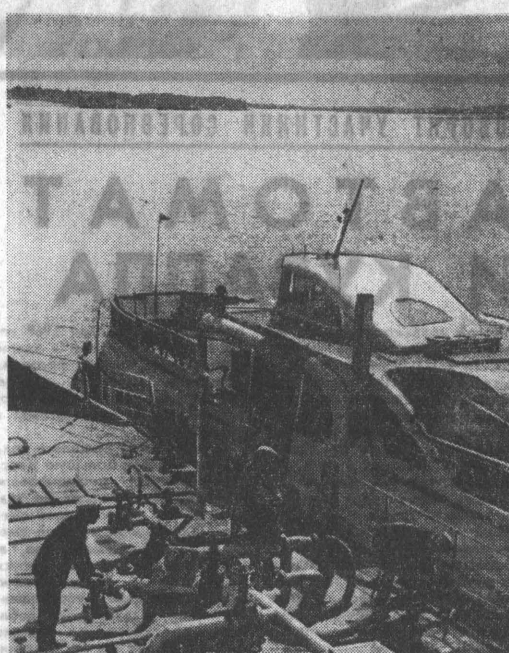
Как было раньше! Суда сливали прямо в Обь отработанные нефтепродукты, подогретые воды. Теперь в Барнауле установлена плавучая станция для очистки воды. Напиво выводится в дело отработанные нефтепродукты и вода в реку сливается чистой.