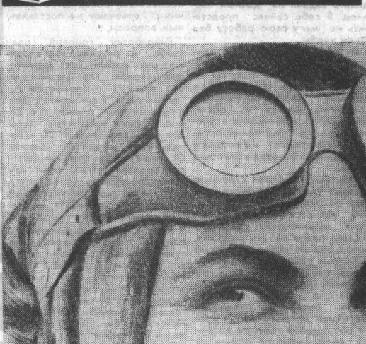
Фото и текст Е. ШЛЕЙ.