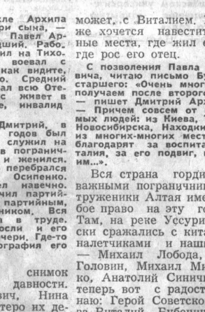
И еще один снимок из...