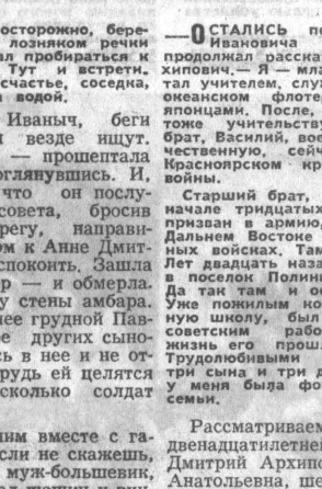
И еще один снимок из...