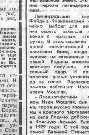
И еще один снимок из...