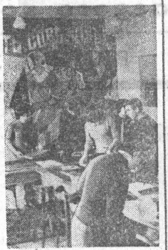
Елена СТАСОВА, член КПСС с 1898 года.

«ГРАНДИОЗНОЕ ДЕЛО СТРОИТЕЛЬСТВА КОМУНИЗМА ФОРМИРУЕТ НАС, ЛЕПИТ НОВЫЕ ХАРАКТЕРЫ, ПРЕДЛАГАЕТ СВОИ ТРУДНОСТИ И ПРИЗЫВАЕТ ПРЕОДОЛЕТЬ ЭТИ ТРУДНОСТИ. ТЕМ ЖЕ ПУТЕМ ШЕЛ САМЫЙ ДОРОГОЙ И СОВРЕМЕННЫЙ НАМ ПОСЛЕДНИЙ ПУТЬ К СЧАСТЬЮ ЧЕЛОВЕК И НЕ БОЙТЕСЬ СКАЗАТЬ В ВЫСОКОМУ МИНУТУ ЖИЗНИ, НАЕДИНЕ С САМИМ СОБОЙ, НАЕДИНЕ С НЕЗАБЫВАЕМЫМ, ВЕСЕЛЫМ И СТРОГОМ ПРИЩУРОМ: «ТОВАРИЩ ЛЕНИН, Я ВАМ ДОКЛАДЫВАЮ!»