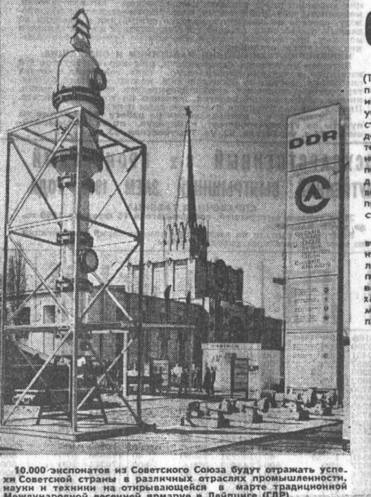
10.000 экспонатов из Советского Союза будут отражать успехи Советской страны в различных отраслях промышленности...